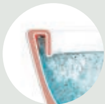
WC-ISTUIN, JOSSA PERIN- TEINEN HUUHTELUKAULUS

Fiksu WC-istuin on hygieeninen ja helppo pitää puhtaana. Mullistamme nyt WC-istuinten kehityksen lanseeraamalla Nautic WC-istuimen, jonka innovatiivinen Hygienic Flush -huuhtelutekniikka puhdistaa optimaalisesti jokaisella huuhtelulla. Avoin huuhtelukaulus eliminoi kaikki likapesät, ja fiksu huuhtelu puhdistaa tehokkaasti avoimen huuhtelukauluksen yläreunaan asti! Hygienic Flush on saatavana myös seinäkiinnitteisenä mallina.