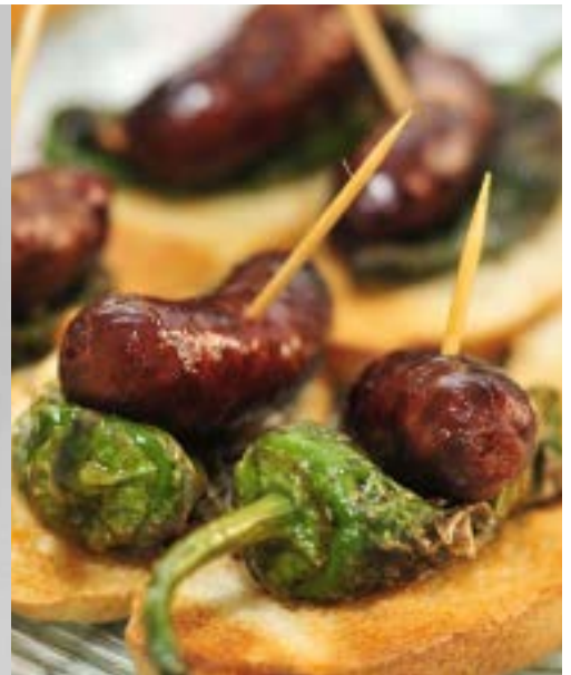
Jon saa inspiraatiota aterioista. Hänen lempiruokaansa ovat pienet suupalat, kuten tapakset ja mezet, joista jokainen voi valita haluamansa.

suunnitellut yrityksille vuosien varrella useita lasi- ja keramiikkatuotteita. Hän on myös sisustanut monia ravintoloita.