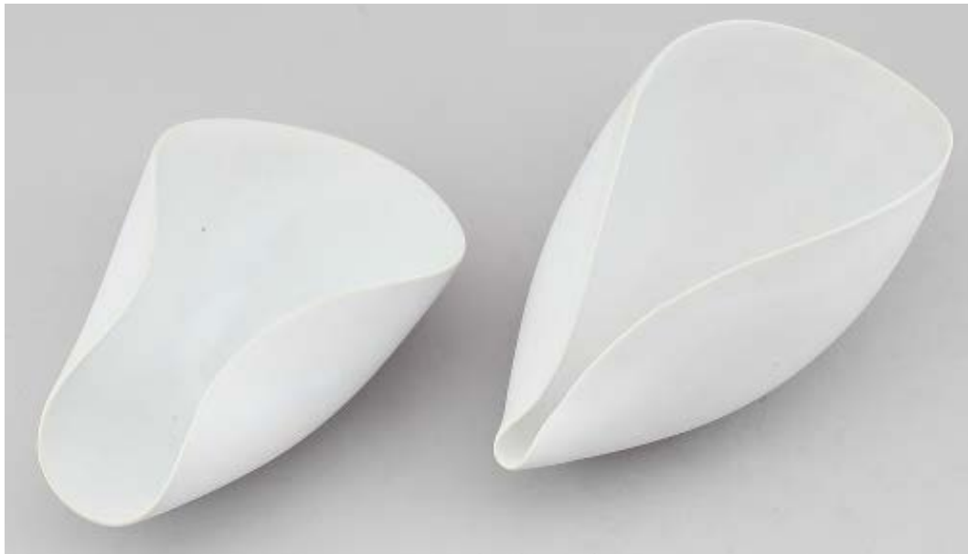
Stig Lindbergin muotoilemia maljakoita. "Uskon, että häntä inspiroivat Välimeren muodot", Jon sanoo.

“ Ateriat ja ruoka ovat suurimpia inspiraation lähteitäni. ”