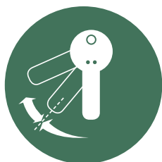
ECO-TAP/ ENERGI BESPARELSE