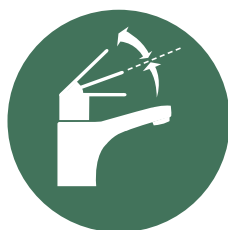
ECO-TAP/ VAND BESPARELSE