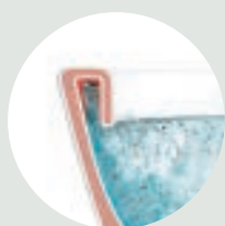
TOALETT MED KONVEN- TIONELL SPOLKANT

En smart toalettstol ska vara hygieniskt ren och lättstädad. Nu revolutionerar vi och lanserar Nautic med den innovativa spoltekniken Hygienic Flush som ger optimal hygien vid varje spolning. En öppen spolkant eliminerar alla smutsfällor och smart spolning gör effektivt rent ända upp till den tunna, lättstädade hygienlisten! Hygienic Flush finns också som golvmonterad modell.