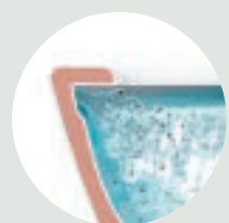
HYGIENIC FLUSH, MED ÖPPEN SPOLKANT

HITTA MER INFORMATION OM HYGIENIC FLUSH PÅ WWW.GUSTAVSBERG.COM /HYGIENICFLUSH